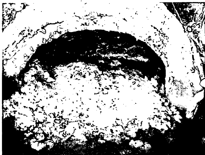
Foto da Manilha concretada