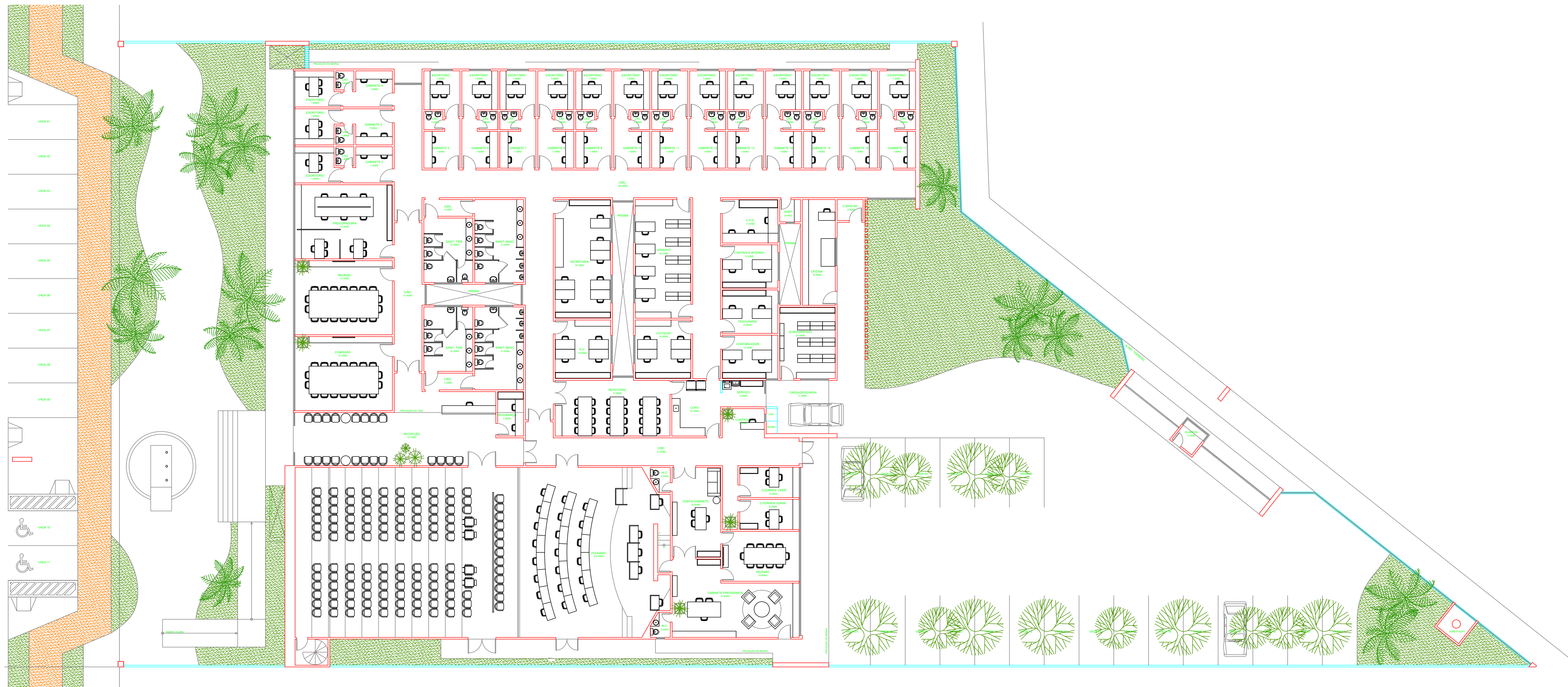
9 LAYOUT esc.: 1/100

PROJETO DE ARQUITETURA PARA CONSTRUÇÃO DA NOVA CÂMARA MUNICIPAL DE CABO FRIO, SITUADA NA AVENIDA HENRIQUE TERRA, LOTE 09, QUADRA 16, NOVO PORTINHO - CABO FRIO - RJ.